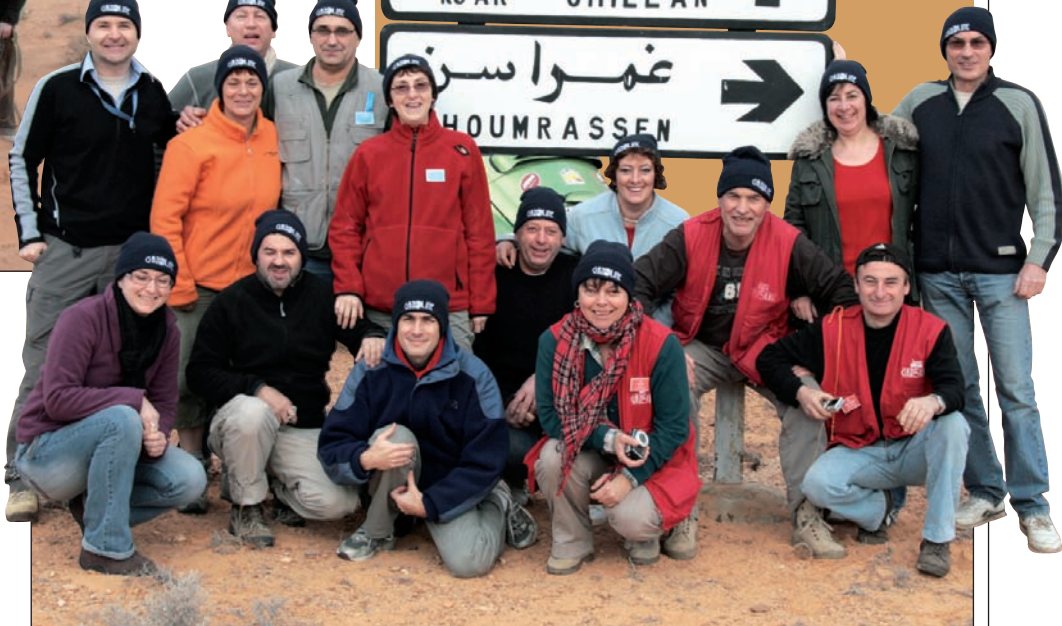
Ksar Ghilane, c'est tout droit, comme l'indique le panneau...