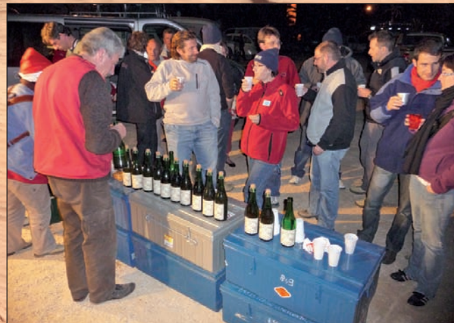
Le soir, c'est détente obli-gée pour se remettre de ses émotions. Autour de la remorque, on improvise un apéritif au cidre breton ! Pas très cou-leur locale, mais revigo-rant...