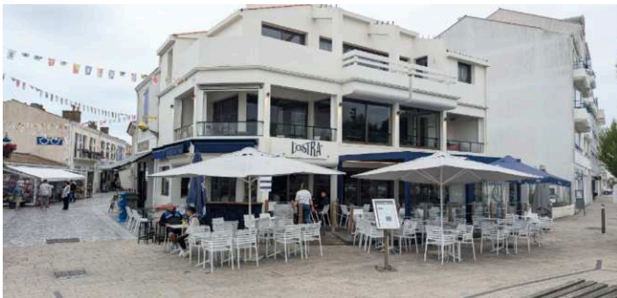
Le bar à huîtres L'Ostra, à l'entrée de la rue piétonne, face au Pont de la Concorde qui enjambe La Vie.