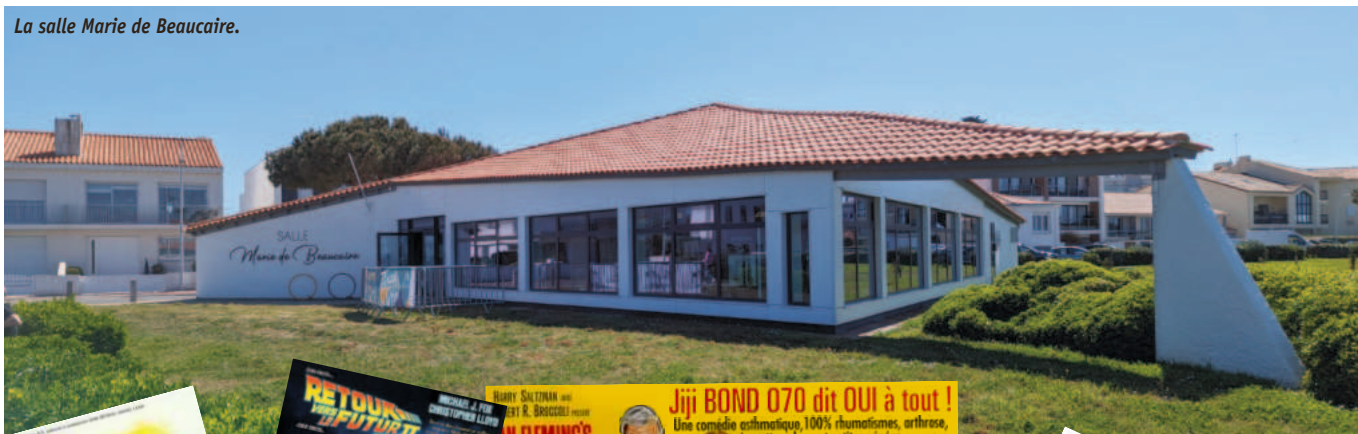
La salle Marie de Beaucaire.