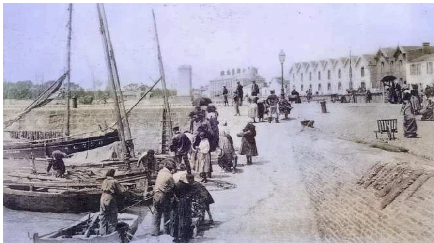
L'arrivée des sardiniers sur le port de pêche de Croix-de-Vie.

Maures mais convertis au christianisme, s'est installé là. On les appelait les Marocains (alors que leurs ancêtres étaient Algériens !), et ils se sont rapidement intégrés, apprenant aux locaux une technique de pêche qui a bouleversé la vie économique de la région : la pêche au filet droit. C'est grâce à leur savoir-faire que la sardine a donné naissance à une industrie locale qui perdure encore. La municipalité a racheté une de ces maisons que l'on peut visiter, 22 rue du Maroc, et dans laquelle on a reconstitué un intérieur des années 20.