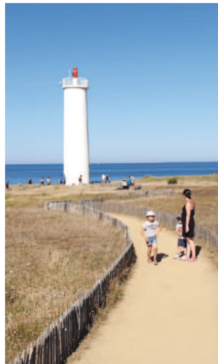
Le feu de Grosse-Terre.

Le petit parcours que je vous ai dessiné va vous conduire vers Les Sables d'Olonne en suivant les trois kilomètres de la Corniche Vendéenne qui relie donc Saint-Gilles-Croix-de-Vie au quartier de Sion, à Saint-Hilaire-de-Riez, en passant par le feu de Grosse-Terre , l'un des derniers grands feux d'horizon