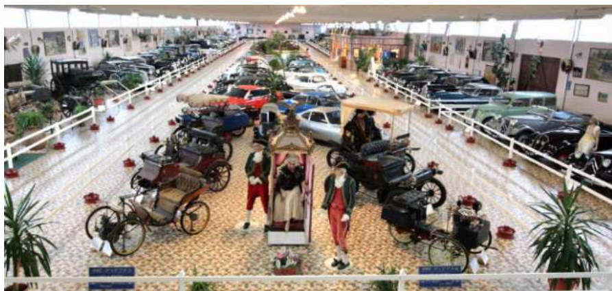
Le Musée Automobile de Vendée.