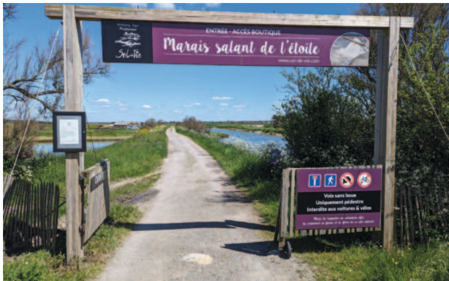
L'entrée des Marais Salants de l'Étoile.