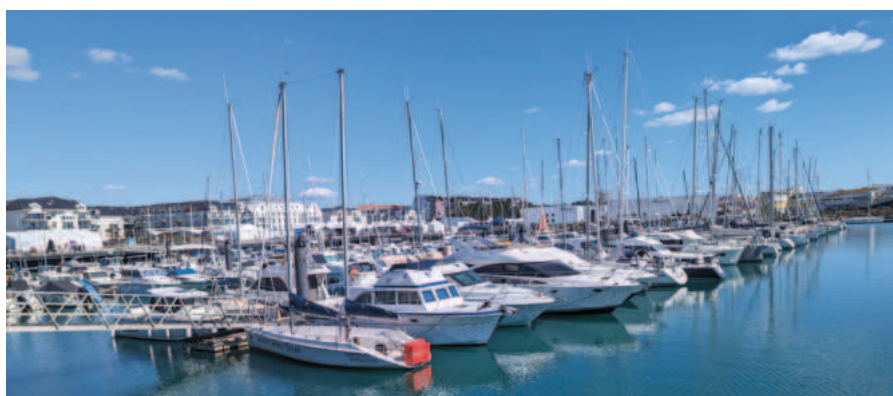
Le port de La Chaume.

- poursuivre jusqu'au centre-ville (visez le Parking du Marché) pour visiter notamment le quartier de l'Île Penotte et ses maisons décorées par une artiste locale qui use et