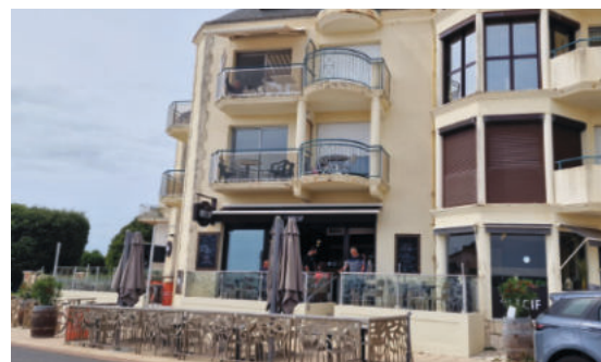
La Crêperie Le Récif.

port de pêcheurs fondé au XVI e siècle, grâce au don de terrains fait par le sieur de Montausier à des marins afin qu'ils y construisent leurs maisons au lieu-dit "La petite île", devenu aujourd'hui le quartier du Maroc, pour rappeler qu'après la décision des Espagnols d'expulser les Morisques (4 avril 1609), un petit nombre de marins, descendants des