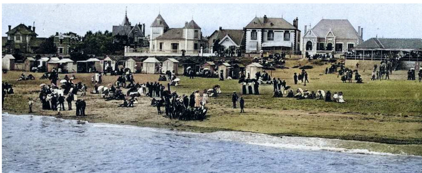
La plage de Boisvinet avec ses premières cabines. On ne se baignait pas encore, on venait prendre le bon air iodé de l'océan.

construits en France (1972) sur la pointe du Grand Fort et dont le faisceau tournant porte à plus de 30 km pour guider les bateaux vers l'entrée du port de Saint-Gilles. La route borde la mer et ses multiples criques façonnées par les marées qui, petit à petit, grignotent les falaises de schistes micacés et de grès veinés de lits de quartz blanc. Le chemin piétonnier qui longe la Corniche a ainsi été reculé de 10 mètres en 70 ans ! Des plateformes ont été aménagées pour admirer le lent et patient travail de l'océan qui, inlassablement, vient goûter le sel de la terre. La deuxième surplombe ce qu'on appelle le Trou du Diable dont on dit qu'il a été créé par un coup de talon du diable, dépité d'avoir perdu son marché avec Saint Martin. Ce dernier avait passé un pacte avec Satan qui lui avait proposé de construire une chaussée entre le continent et l'île d'Yeu que l'on aperçoit parfois au loin afin qu'il y prêche la bonne parole en échange de la première âme à y passer. Le prêcheur avait accepté le marché en y mettant une condi-