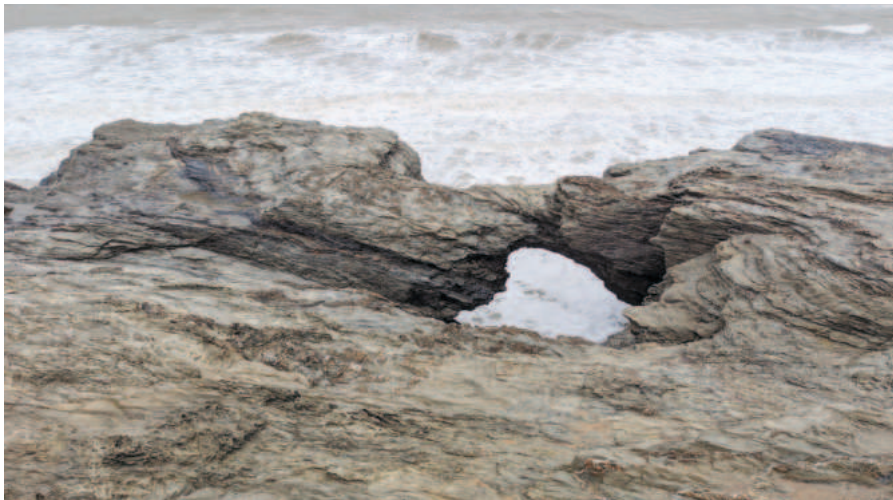
Ci-dessus : le Trou du Diable... Dessous : l'Hôtel Frédéric et le Café de la Plage.