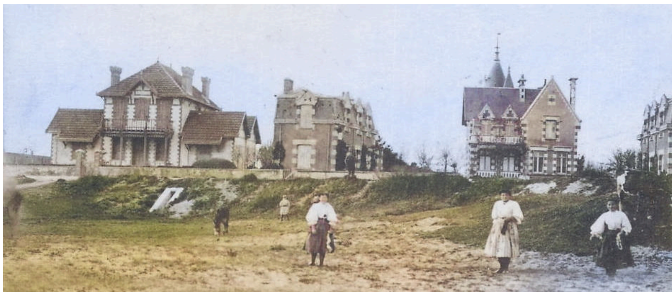
La plage de Boisvinet dans les années 1930 avec, à droite, la villa La Sapinière, Ker Yann (aujourd'hui disparue) et Boisvinet.

Comme promis, voici le détail de la journée du 2 novembre 2024 !