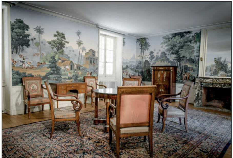
Le salon des deux Amériques du château de la Verrerie.

L'après-midi, pourquoi ne pas pousser jusqu'à Montceau-les-Mines et visiter la Galerie du camion ancien , dans l'ancienne usine Alliot qui fabriquait des rouleaux compresseurs pour les entreprises de travaux publics et abrite aujourd'hui une vingtaine