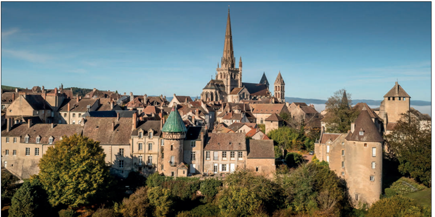
La ville d'Autun et sa cathédrale.