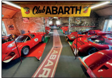
Vue sur la collection Abarth à Savigny-les-Beaune.