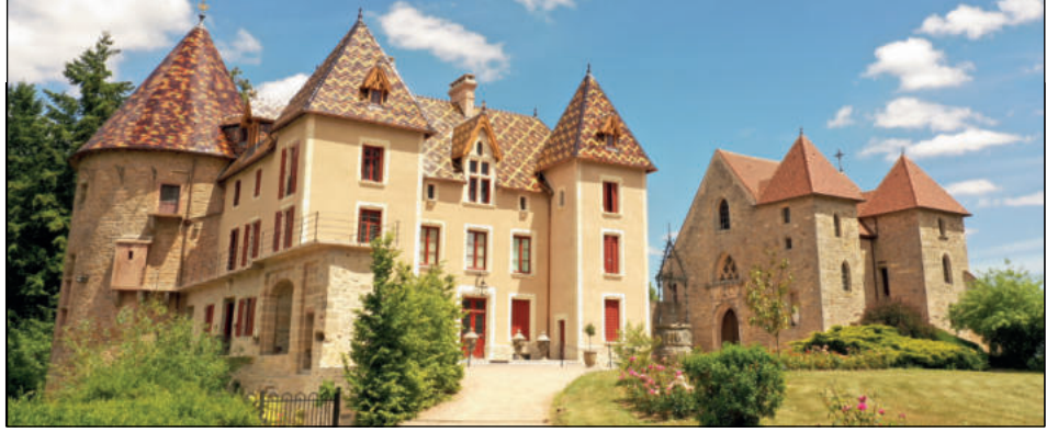
Le magnifique château de Couches, appelé aussi château de la reine Marguerite.

Parcours d'environ 180 km dans le Morvan.