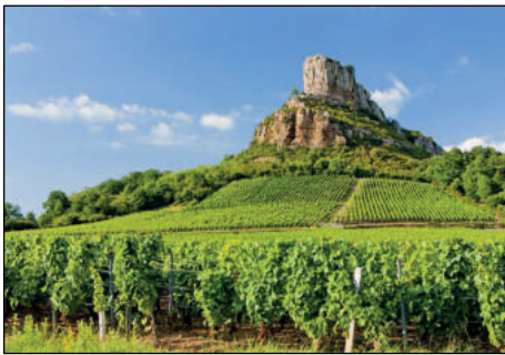
La roche de Solutré.