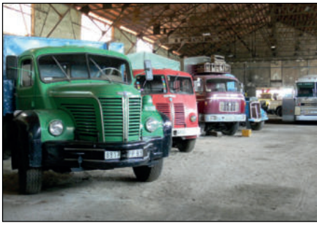
Les mythiques camions dans l'ancienne usine Alliot.

de poids lourds des années 1941 à 1986, dont quelques pièces remarquables, Berliet GBC 8 6x6, celui qui a été conduit par Lino Ventura dans Cent mille dollars au soleil , le film mythique d'Henri Verneuil. Quatorze de ces engins sont inscrits aux Monuments historiques.