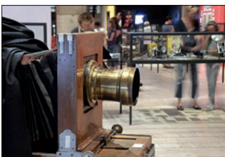
Musée Nicéphore Niépce.

reflète, comme le fait celui de Chambord.