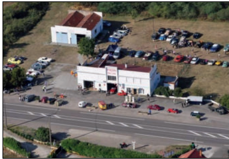
Station Bel Air à La Rochepot.