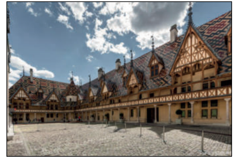
La cour intérieure des Hospices de Beaune.

encore, si vous souhaitez faire acte de candidature, faites-le nous savoir par mail en précisant que vous postulez pour la Section Jeunes. Vous sentez, comme moi, un parfum de revenez-y, non ? C'est pas faux, comme dirait l'autre. Le superbe rallye du Maroc a ravivé tellement de souvenirs qu'il a fait naître de ces idées un peu folles qui ont conduit, un jour, à la création de votre association. Qui sait, peut-être préparons-nous son avenir ?