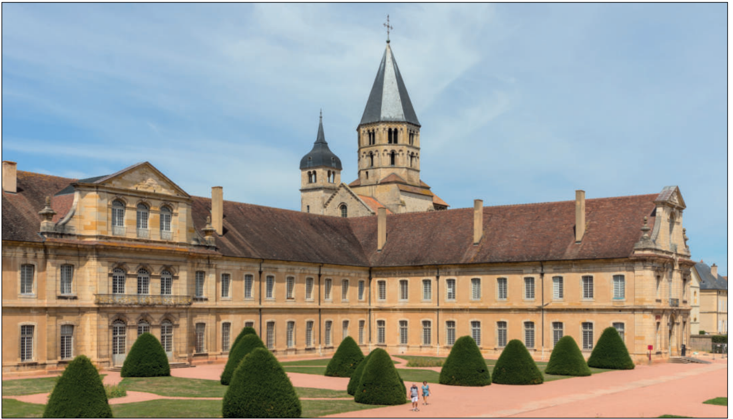
L'abbaye bénédictine de Cluny.