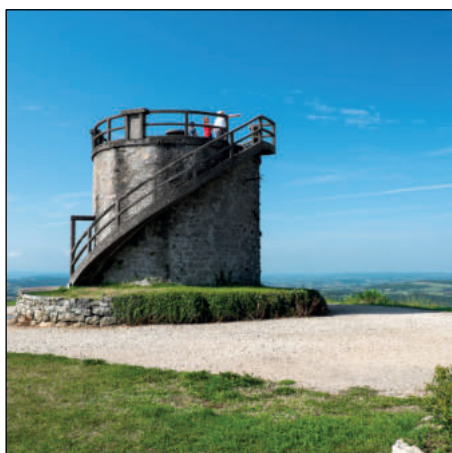
Le Belvédère du Mont-Saint-Vincent offre une incroyable vue à 360° sur pas moins de quatorze départements. A vous de les trouver.