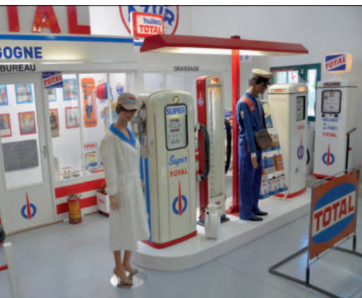
Musée de la pompe à essence.