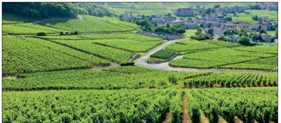
La balade dans le vignoble de Bourgogne, on vous la propose le dernier jour. Profitez-en pour faire le plein de grands crus.