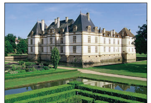
Le château de Cormatin.

- Cormatin et son château du XVII e siècle entouré de douves dans lequel il se